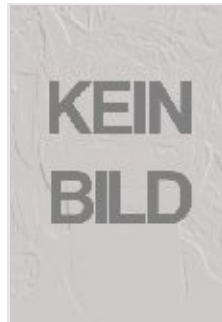
Marcel Fricke Alter: 22 Zuletzt: BSV Bielstein Position: Abwehr